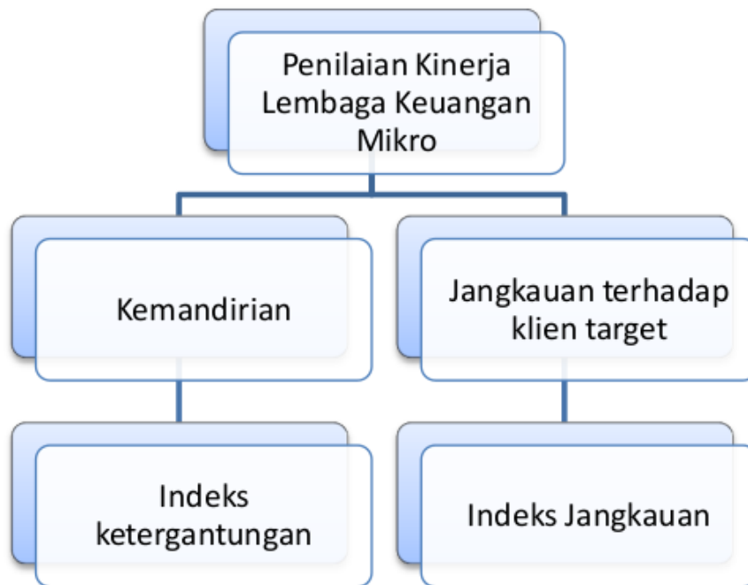
Gambar 6. Penilaian Kinerja Lembaga Keuangan Mikro

jangkauan. 63 LKM dianggap sebagai perantara keuangan yang bertujuan menyediakan akses yang lebih mudah untuk memperoleh kredit bagi orang-orang yang berpenghasilan rendah, maka LKM mesti memiliki kemampuan finansial untuk mencapai kemandirian ( self-sustainability ). Indikator kinerja harus didasarkan pada kemampuan keuangannya dan kemampuan LKM dalam melayani masyarakat, yang disebut jangkauan seperti yang terlihat pada gambar